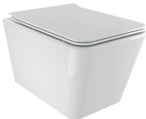
IMMAGINE PRODOTTO / PRODUCT IMAGE