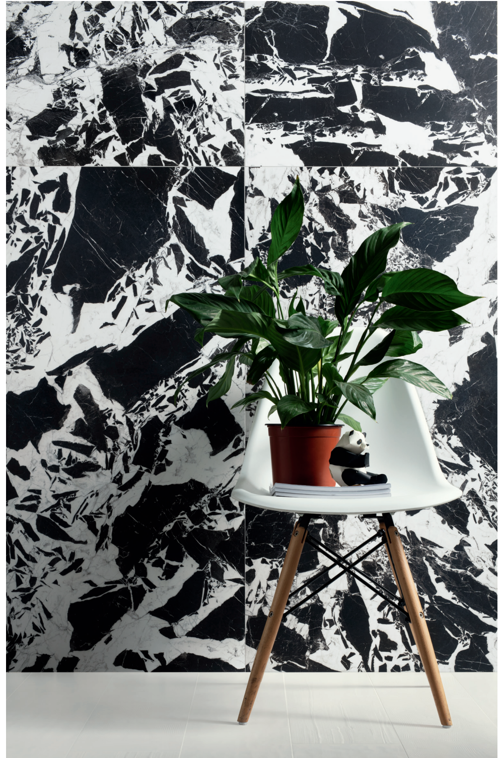
WALL SUPREME 60X120 24"X48"